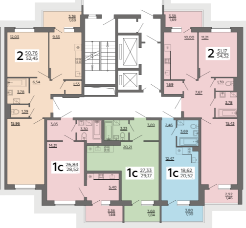
СЕКЦИЯ 4 2-17 ЭТАЖ