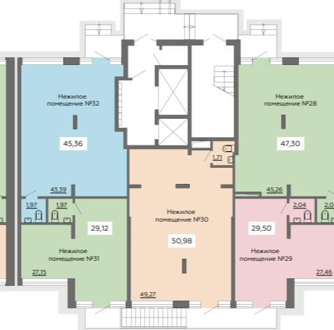
СЕКЦИЯ 5 1 ЭТАЖ