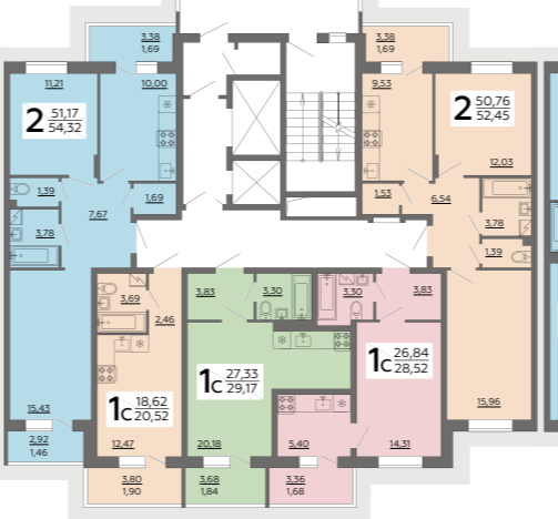
СЕКЦИЯ 5 2-17 ЭТАЖ