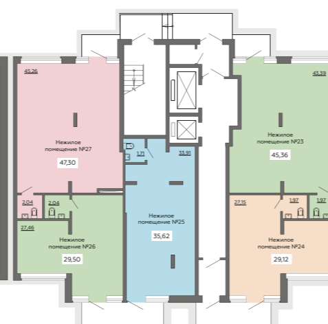
СЕКЦИЯ 4 1 ЭТАЖ